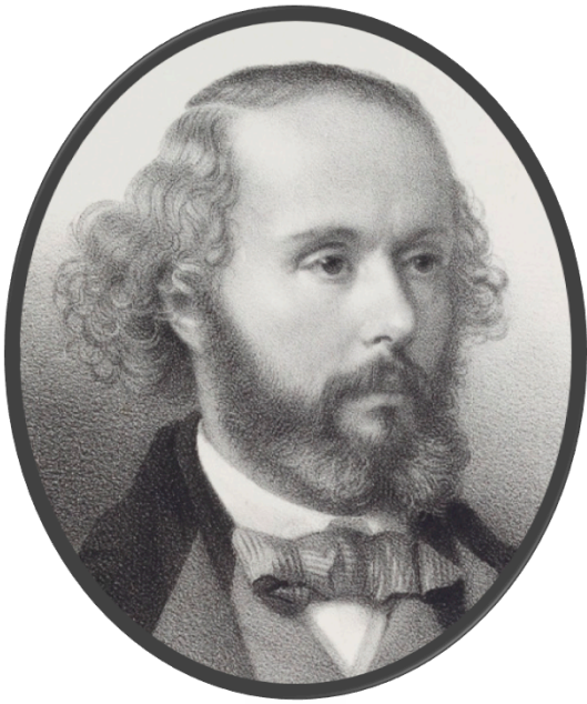
..... Félicien DAVID (1810-1876)

LallaRoukh est un opéra-comique français en deux actes de Félicien David, créé en 1862, sur un livret de Michel Carré et Hippolyte Lucas, d'après un poème de Thomas Moore.